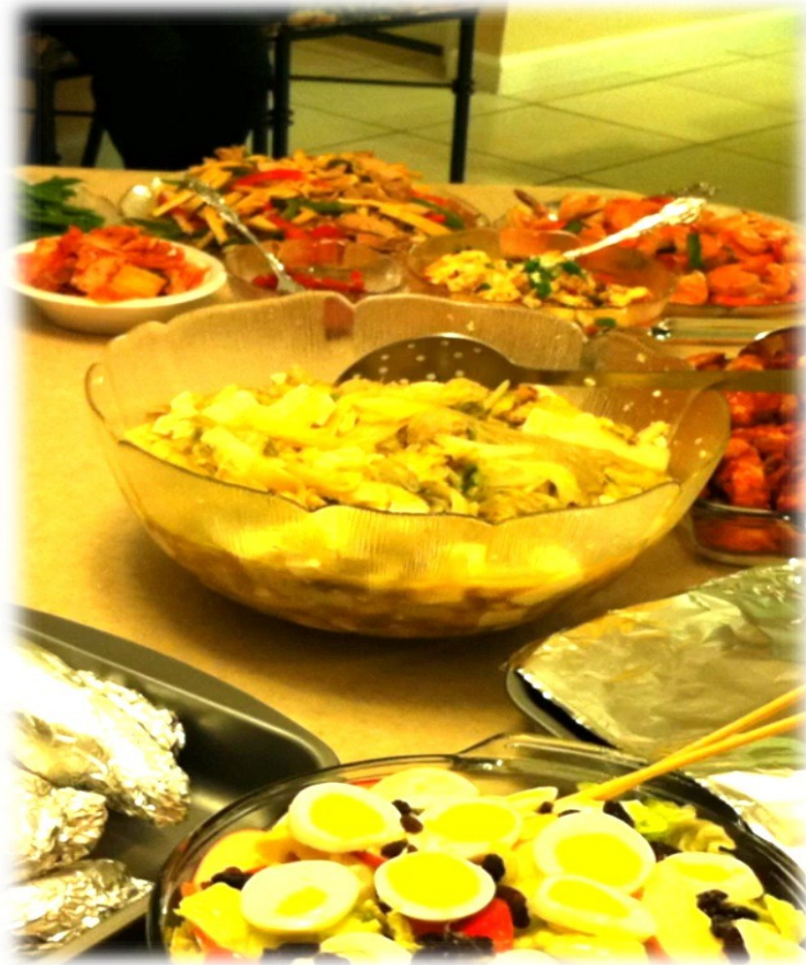
圖七 精美的大餐的一部分

在相聚的屋中, 我們用床單當銀幕, 架上各樣手提影音器材. 這六加一家, 立時唱出一首又一首的讚美感恩詩歌. 整個屋內, 洋溢著美善的喜樂與平安. 在每一首詩歌后, 一家一家按序述說神的恩典與豐盛的賜下: