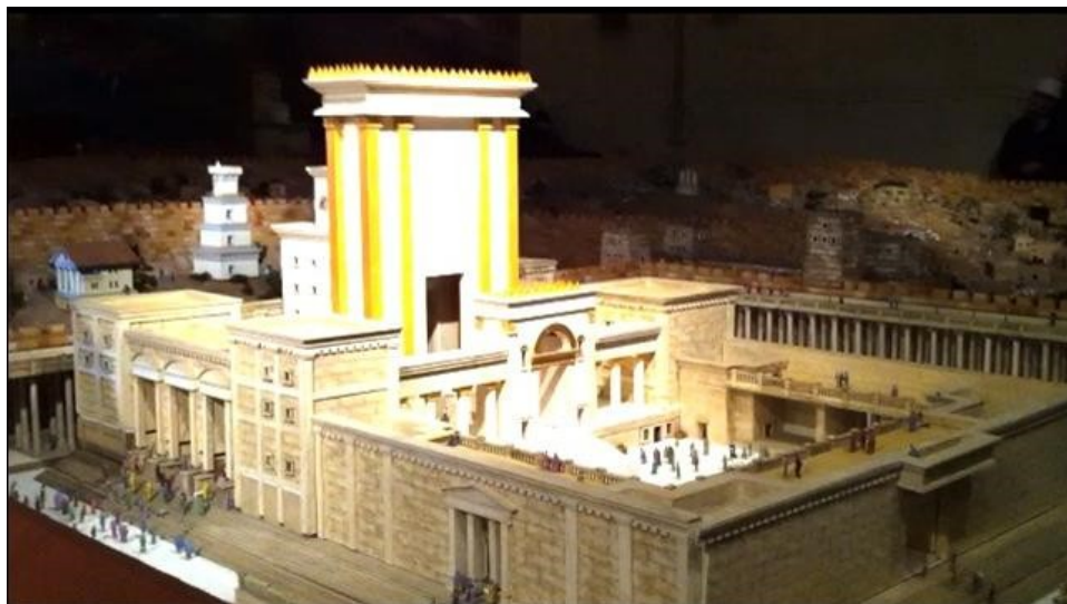
圖四 主後64年的聖殿