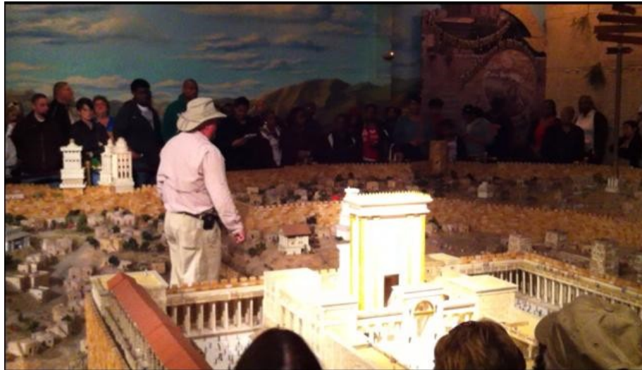
圖三 耶路撒冷實體模型

“聖地經驗”提供了一個號稱為世上最大的耶路撒冷實體模型。圖三顯示此一模型的規模。