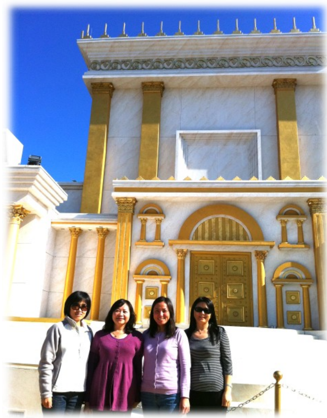
圖二 主後64年的聖所

大希律從主前約20年, 開始重建聖殿. 此一重建的過程至主後64年才正式完成. 當主耶穌第一次潔淨聖殿時, 此殿的重建已經歷經了46年 (約2:20). 圖二中的四位姐妹正站在一處當年婦女不准進入的禁區. 圖中的背景正是主後64年聖所的外觀.