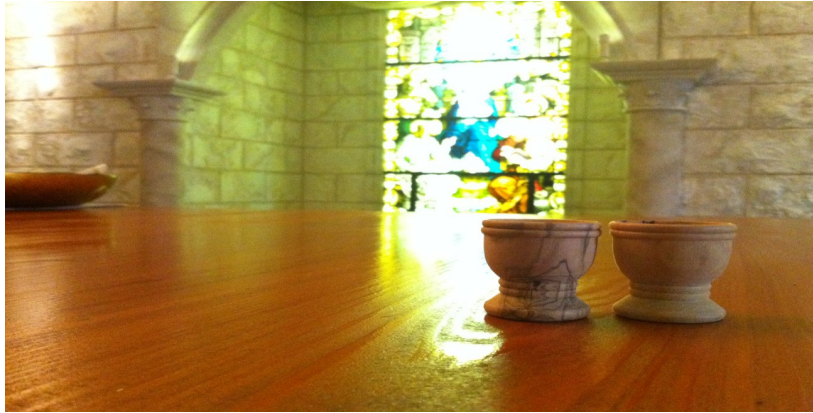
圖一 橄欖木聖餐杯